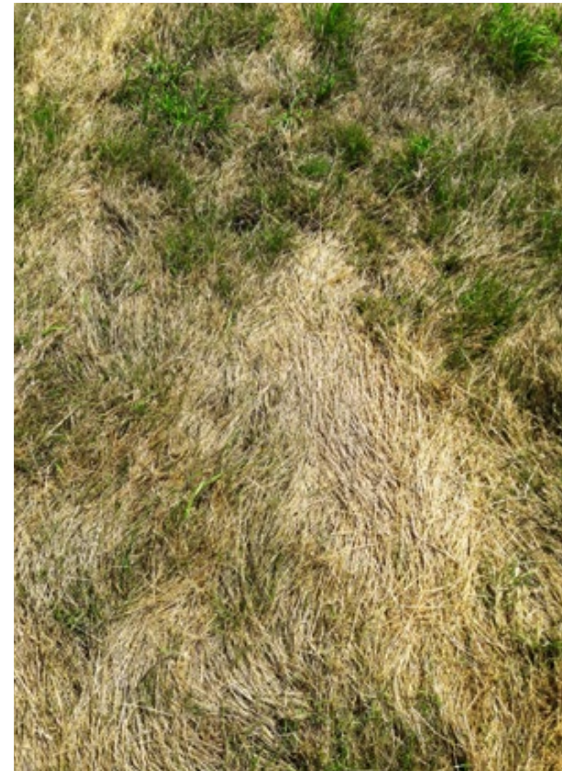
■ Zode zonder en mét voorbeweiden

Zode na uitgestelde maaidatum op 15 mei, zonder (links) en met voorbeweiding tot 8 mei.