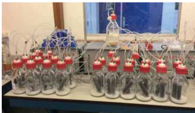
FIGUUR 2: RESPIRATIEMETINGEN AAN VEENKOLommen GEMENGD MET KLEI.

van belang zijn voor de binding van organische stof in veengrond.