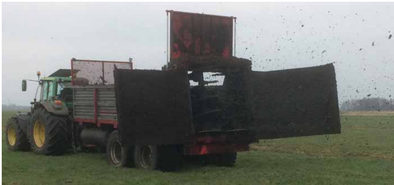
FIGUUR 3: KLEITOEPASSING IN HET VELD.

Kleigrond en -bagger met voor dit doel geschikte eigenschappen moet van buitenaf worden aangevoerd. Ieder jaar verplaatsen we in Nederland 80 miljoen ton grond en bagger, we zijn dus goed in de logistieke aspecten die daar normaal gesproken bij komen kijken. De uitdaging voor de veenweidegebieden zit in de beperkte draagkracht van de ondergrond en de capaciteit van het wegstelsel. Ook is afstemming nodig met de gewenste afvoercapaciteit.