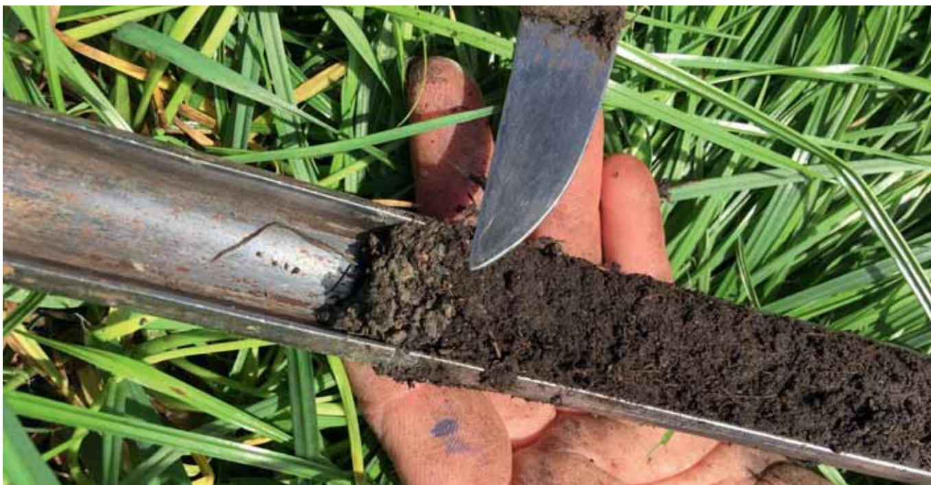
FIGUUR 4: KLEILAAGJE IN HET BODEMPROFIEL NA KLEITOEPASSING IN HET VELD.

citeit bij de projecten waarbij kleigrond afgevoerd dient te worden. Om deze projectdoelstellingen te halen wordt klei afgevoerd met duizenden m 3 per dag. Een oplossing kan worden gevonden in het spreiden over tijd en plaats over de 200.000 hectare van het Groene Hart. Voor de natte kleibaggerstromen wordt gedacht aan transport met een persleiding.